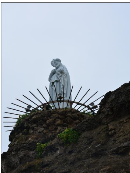
Biarritz Rocher de la Vierge